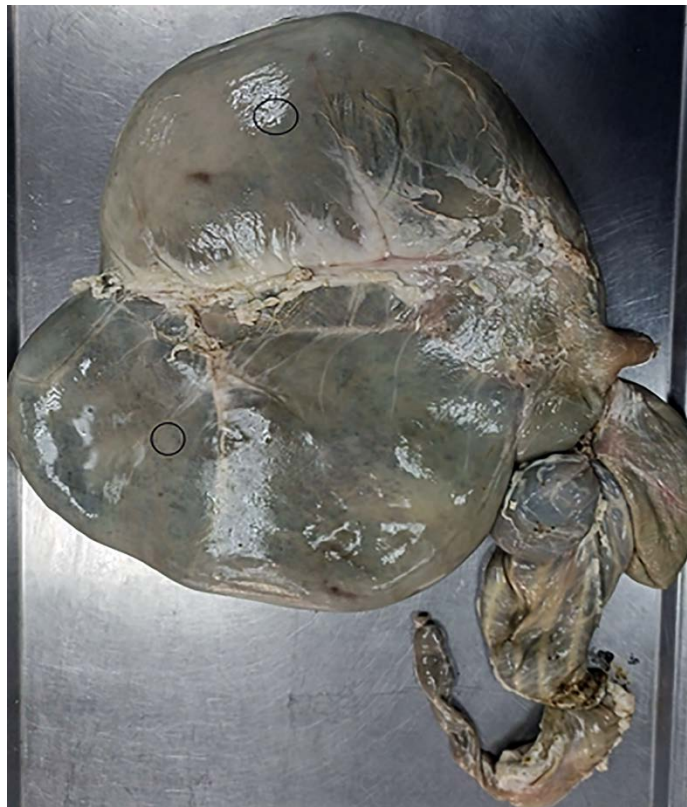
Рисунок 1 – Париетальная поверхность рубца овцы

На фотографии париетальной поверхности рубца четко просматриваются дорсальный и вентральный мешки, а также центральная борозда (рис. 1).