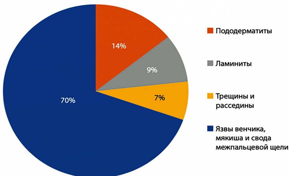
Рисунок 2 – Частота встречаемости различных видов ортопедической патологии

При анализе этиологических факторов наиболее распространенными являются круглогодичное безвыгульное содержание (57 %) и несбалансированное кормление животных (преобладание белкового типа кормления, пониженное содержание кальция и фосфора) (69 %). В некоторых случаях встречались